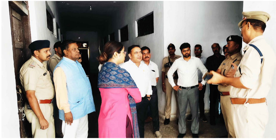
विस क्षेत्र के 245 पोलिंग बूथ पर पहुंचे मतदाता, सुबह 7 से शाम 6 बजे तक चला मतदान